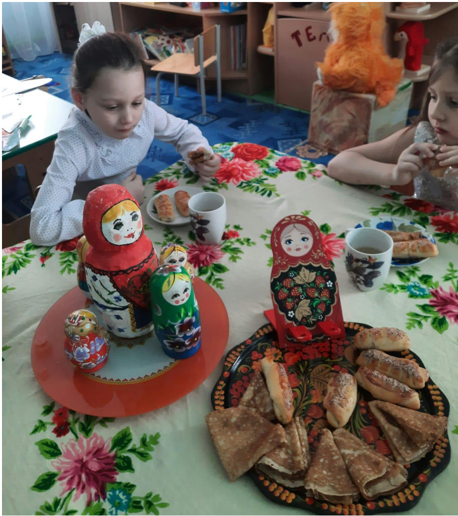
«Весна –Красна пришла»